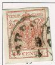
Cifra "4" inclinata a sinistra