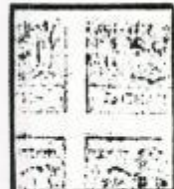
Stampa al verso capovolta