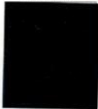
Voluta sotto la corona a fondo pieno. Ghiande più grandi dell'originale.