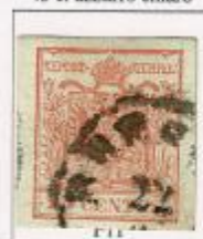
Cifra "4" diritta. Cifra "5" con asta superiore più corta