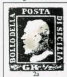
II TAVOLA - NA