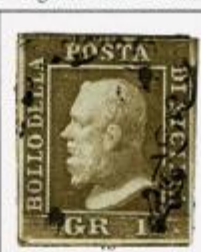
II TAVOLA - NA