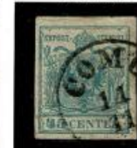
Seconda "E" di "Centes" intatta