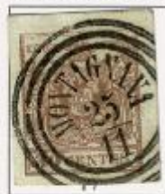
Penne della coda rivolte verso il basso. Puntino sotto K