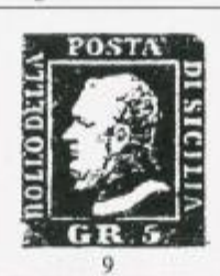
I TAVOLA Angolo superiore destro smussato