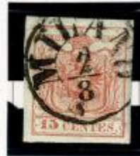
Foglia di palma con punta rivolta a destra. Cifra "1" intaccata in alto