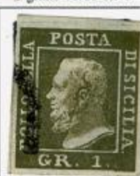
III TAVOLA - PA Stampa accurata