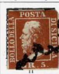
II TAVOLA Angolo intero