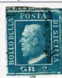
I TAVOLA - NA