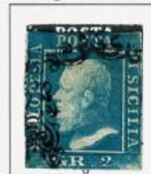
I TAVOLA - PA Punto bianco vicino al naso o al sopracciglio