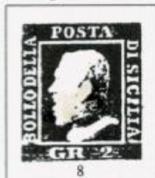
III TAVOLA - PA Stampa accurata. Assenza di punti