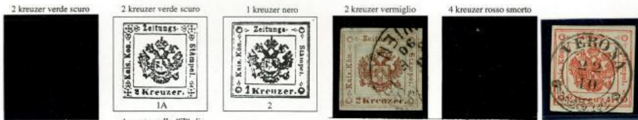
Accento sulla "Z" di "Zeitung".

1853-59 - Stemma Austro-Ungarico. Stampa tipografica. Fogli di 400 esemplari. Non dentellati.