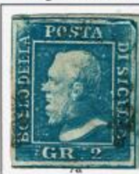
II TAVOLA - NA