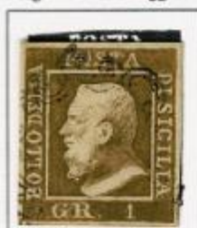
I TAVOLA Lettere "ST" di "Posta" unite tra loro