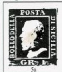
III TAVOLA - NA