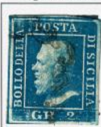
II TAVOLA - PA