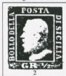
II TAVOLA - PA