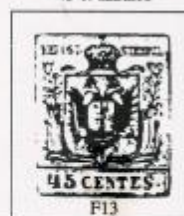
Punto sulla cifra "4"