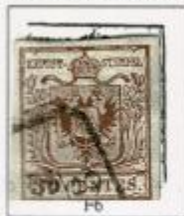
Penne della coda dell'aquila rivolte verso l'esterno