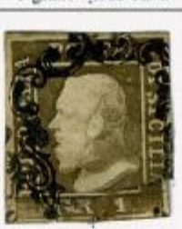
II TAVOLA - PA