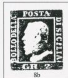
III TAVOLA - NA