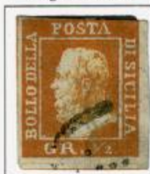
I TAVOLA - PA Angolo superiore destro smussato o punto su 'A' di "Posta"