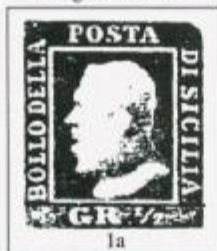
I TAVOLA - NA